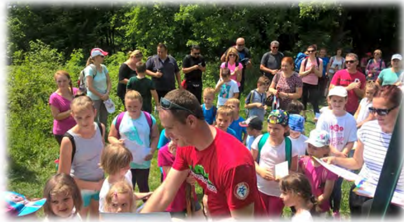
Japetić – izlet za djecu i roditelje

Pitanje: Kome se grupa prilagođava prilikom kretanja u planini? (Vodiču Igoru, on mora biti prvi ... dosta...nećemo više?)